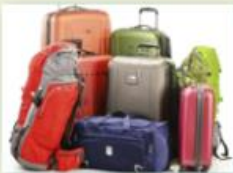
les bagages (m)