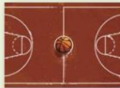
le terrain de