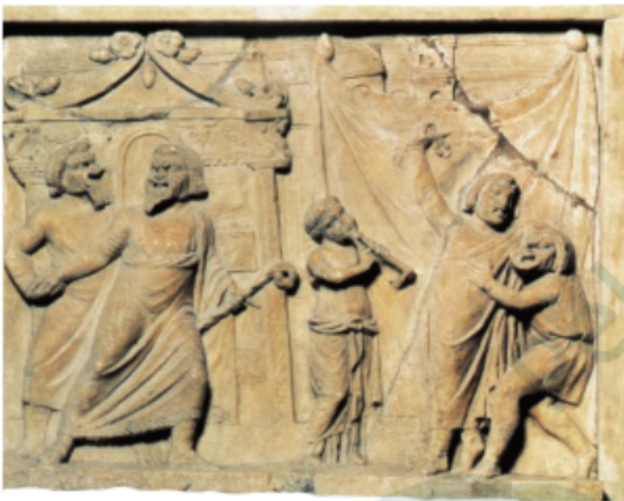
Een zoon (rechts) komt dronken thuis; zijn vader (links) wil hem een lesje leren. In het midden staat een fluitspeler.