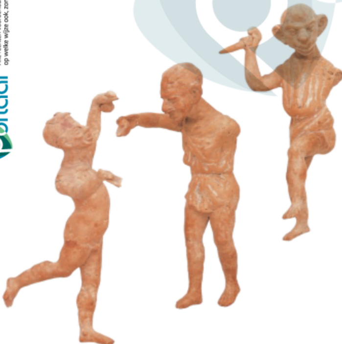
7 Deze beeldjes stellen een groepje mimespelers voor. Ze hebben een mes, een lamp en een geldbeurs in hun hand.