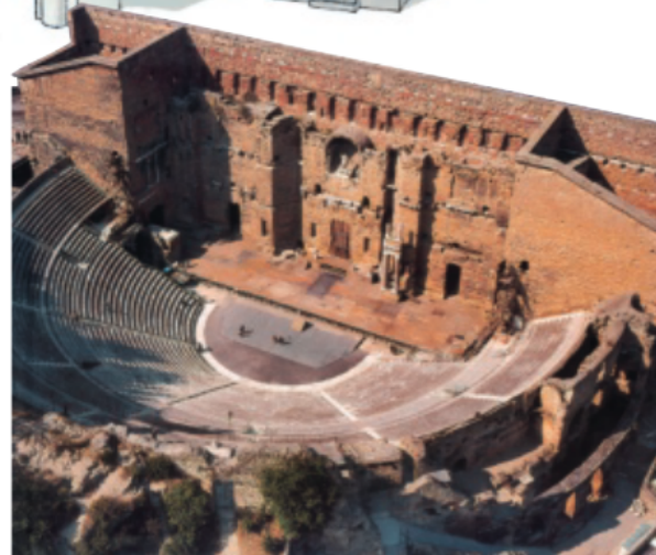
4 Het theater van Orange.

©2019 Peickmans Portaal maakt deel uit van Peickmans uitgevers nv Brasschaatsteenweg 308 - 2920 Kalmthout - België - peickmansuitgevers.be Alle rechten voorbehouden. Niets uit deze uitgave mag worden vervoerd, opgeslagen in een geautomatiseerd gegevensbestand of openbaar gemaakt, op welke wijze ook, zonder de uitdrukkelijke voorafgaande en schriftelijke toestemming van de uitgever, behalve in geval van wettelijke uitzondering.