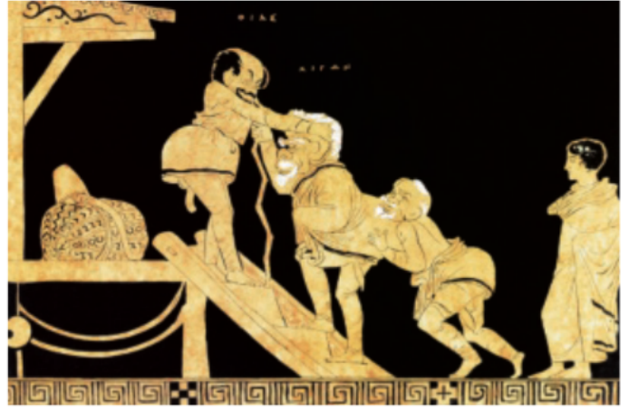
1 Op een Griekse vaas uit Zuid-Italië duwen twee dienaren een oude acteur via een trap het podium van een houten theater op.

grootvader, geboren in Athene, zocht samen met vele landgenoten zijn geluk in Zuid-Italië.