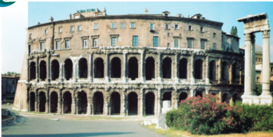
3 Het theater van Marcellus in Rome. Een adellijke familie bewoont sinds ca. 1600 de bovenste verdieping.