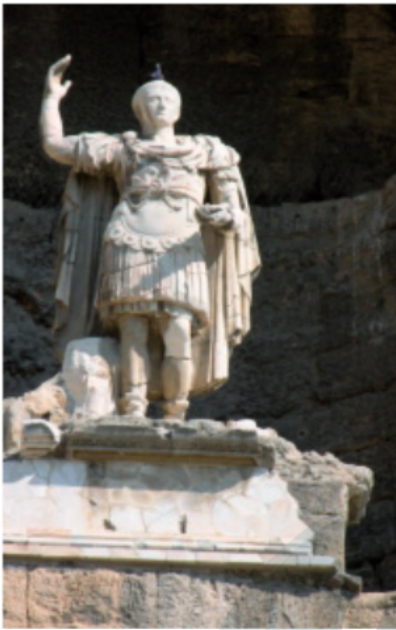
beeld van keizer Augustus in rale nis van een scènemuur.

Voor het spannen van het velum of zeil zijn ter plaatse matrozen aanwezig.